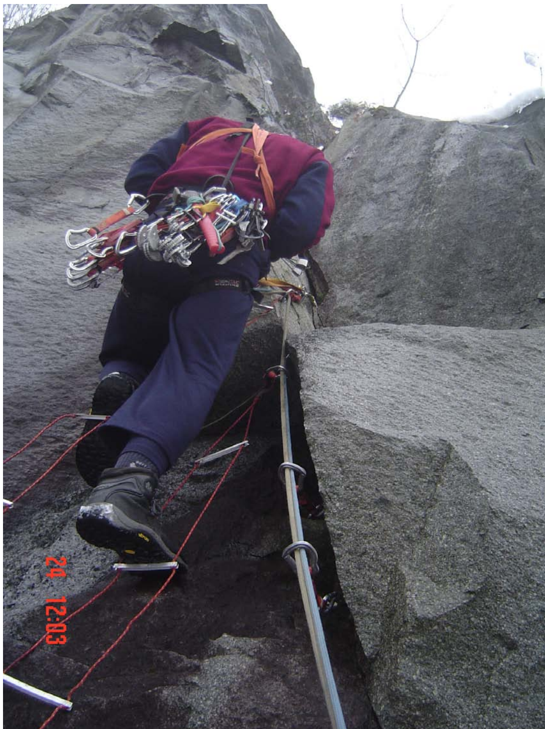
Čardak, alpinisti iz Beograda, jedan od kamenoloma, januar 2007. god