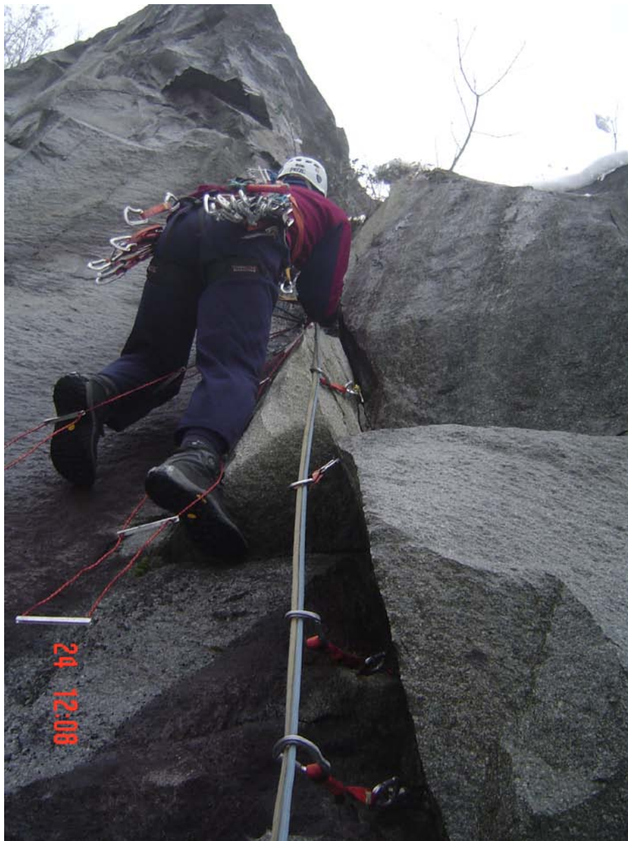
Čardak, januar 2007. godine, alpinisti iz Beograda