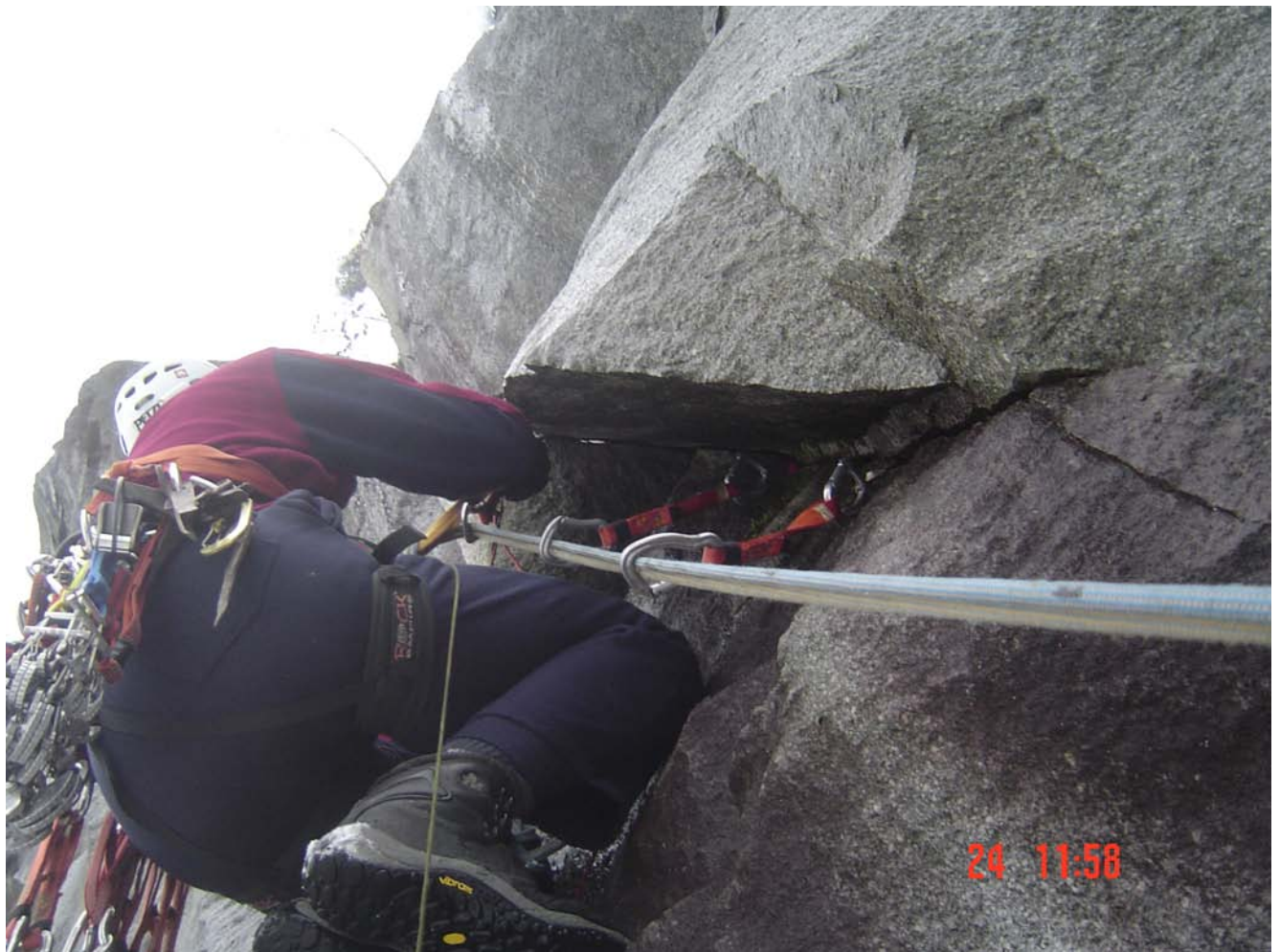
Čardak, januar 2007. godine, alpinisti iz Beograda